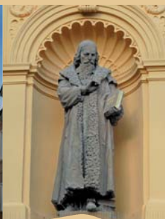
DETAIL NA ZS