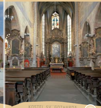
KOSTEL SV. GOTHARDA - INTERIER