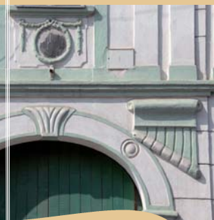
SOUKENICKÁ UL. - DETAIL PORTÁLU