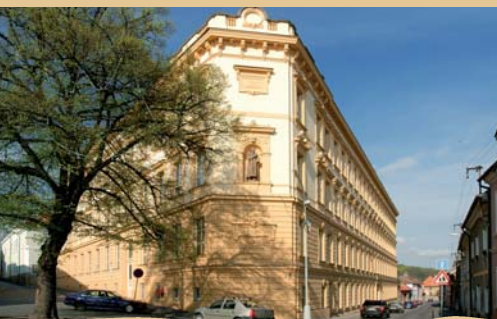
KOMENSKÉ NÁMĚSTÍ - ZS