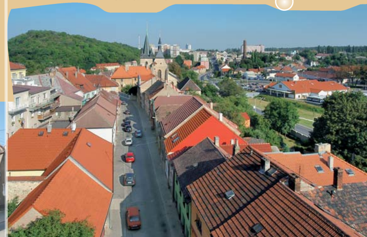
POHLED NA ŠTECHOVU UL. - V POZADÍ SLÁNSKÁ HORA A VĚŽE KOSTELA SV. GOTHARDA