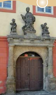
MODLETICKÝ DŮM - PORTÁL