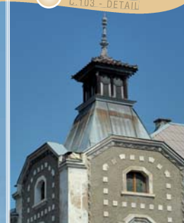
ROHOVÝ DŮM Č. 103 - DETAIL

Dům čp. 114 - při přestavbě bývalého hejtmánství zde byl proveden archeologický výzkum, který odkryl dvě obezděná stavení zapuštěná do