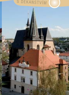
KOSTEL SV. GOTHARDA S DEKANSTVÍM