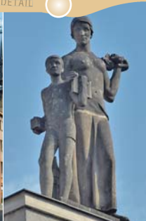
SOUŠOŠÍ SPOŘIVOSTI - DETAIL