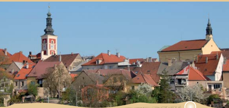
VLEVO VĚŽ BÝVALÉ RADNICE, VPRÁVO VĚŽ PIARISTICKÉ KOLEJE