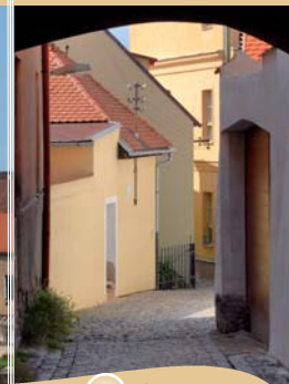
PRŮCHOD ZE ŠTECHOVA ULICE NA MASARYKOVO NÁM.

a pochází z ateliéru akademického sochaře Václava Nejtka, stejně tak jako bronzový dvojrélief nad hlavním vchodem a reliéf z kararského mramoru ve vestibulu.