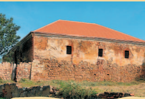
TVRZ V NEPROBYLICÍCH