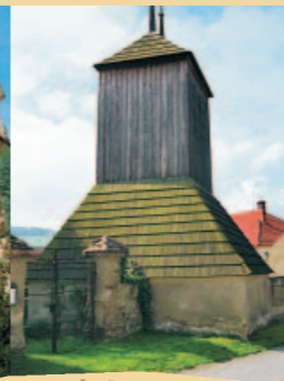
DŘEVĚNÁ ZVONICE V HOŘEŠOVIČÍCH