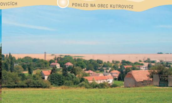
POHLED NA OBEC KUTROVICE