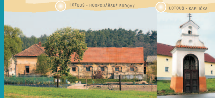
LOTOUŠ - HOSPODÁŘSKÉ BUDOVY

LOTOUŠ – Písek Spojené obce, z nichž historicky starší je Lotouš. Na katastru obce bylo odkryto pohřebiště se skřeny kostrymi typu únětického. První písemné zmínky o vsi jsou z let 1227 - 28. Ves Lotouš patřila městu Slanému, kterému ale byla v roce 1547 konfiskována, roku 1562 vrácena a podruhé konfiskována po Bílé Hoře (1623), kdy s celým panstvím přešla do majetku smečenských Martiniců. Berní rula z roku 1654 zde uvádí čtyři statky a ty tvořily základ vsi ještě na počátku 20. stol. Tehdy se tu navíc uvádí ještě tři domky a kaplička sv. Trojice z pol. 19. stol. V osadě Písku u státní silnice byl nejvýznamnější stavbou zájezdní hostinec. Samota Libuš připomíná dobu dolování uhlí; blízké šachty Libuš a Arnošt patřily uhelnému revíru Beyerů od sv. Jána u Libovice.