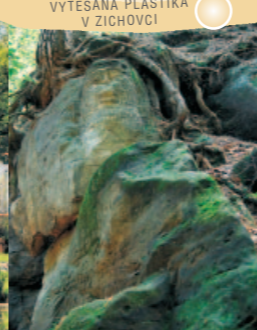
VYTESANÁ PLASTIKA V ZICHOVCI