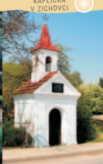
KAPLIČKA V ZICHOVCI