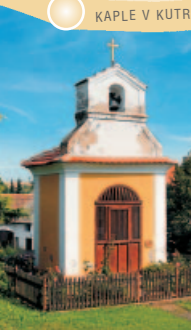
KAPLE V KUTROVICÍCH