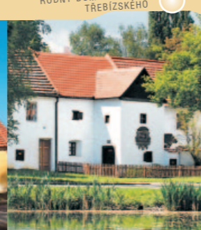
RODNÝ DŮM V. BENEŠE TŘEBÍZSKÉHO