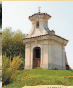
KAPLE SV. MARTINA V HOŘEŠOVIČKÁCH