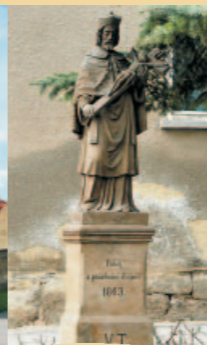
SV. JAN NEPOMUCKÝ HOŘEŠOVICE