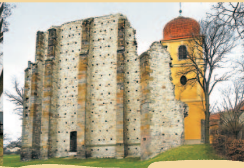
NEDOSTAVĚNÝ CHRÁM V PANENSKÉM TÝNCI