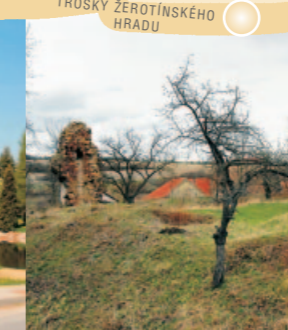
TROSKY ŽEROTÍNSKÉHO HRADU