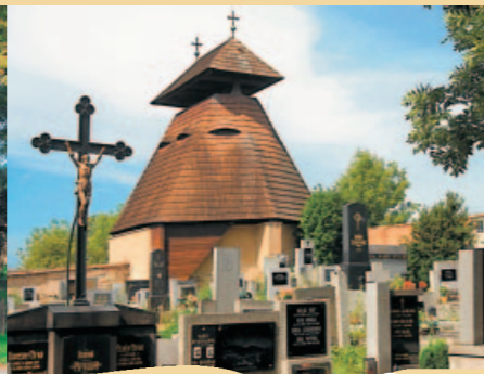
DŘEVĚNÁ ZVONICE VE KVÍLICÍCH